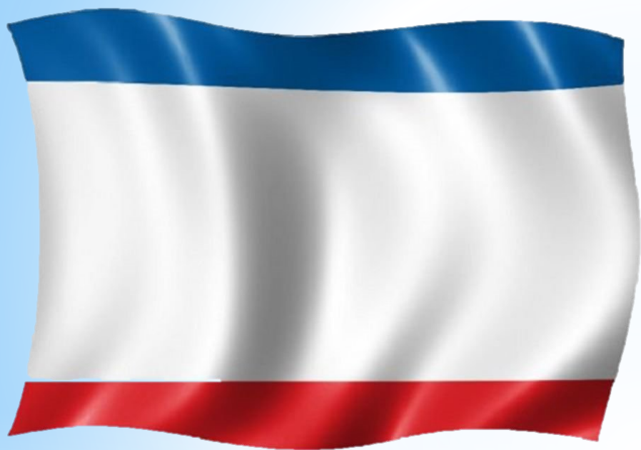
Флаг республики Крым

Крым является республикой. Флаг республики Крым, как и флаг России, тоже трехцветный.