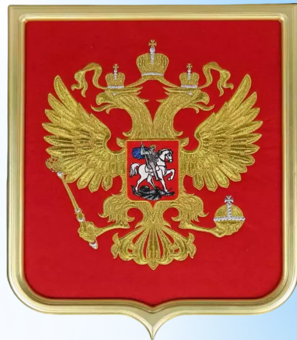
Герб Российской Федерации (России)

На гербе изображен серебряный грифон, держащий в правой лапе раскрытую раковину с голубой жемчужиной.