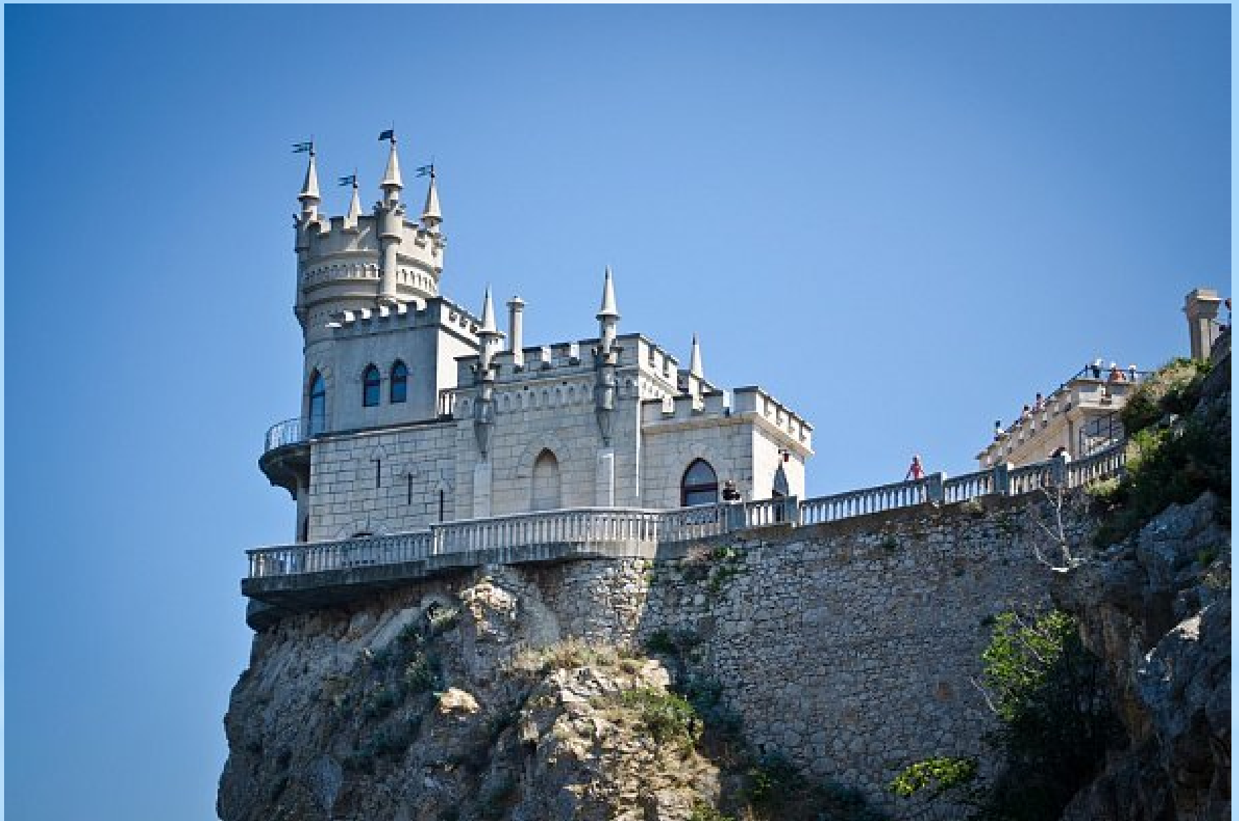
«Ласточкино гнездо» – игрушечный замок-дворец на отвесной скале, в городе Ялта на Южном берегу Крыма.