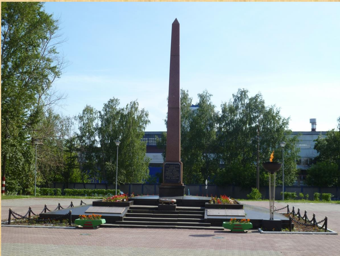
Мемориальный парк на ул. Ломоносова